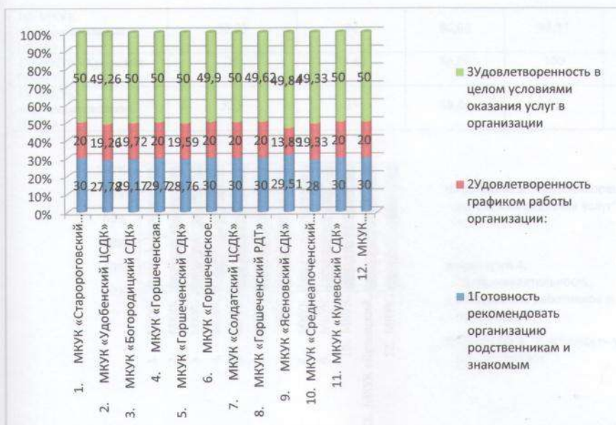
Рис 4. Сведения по критерию 5 «Удовлетворенность условиями оказания услуг»