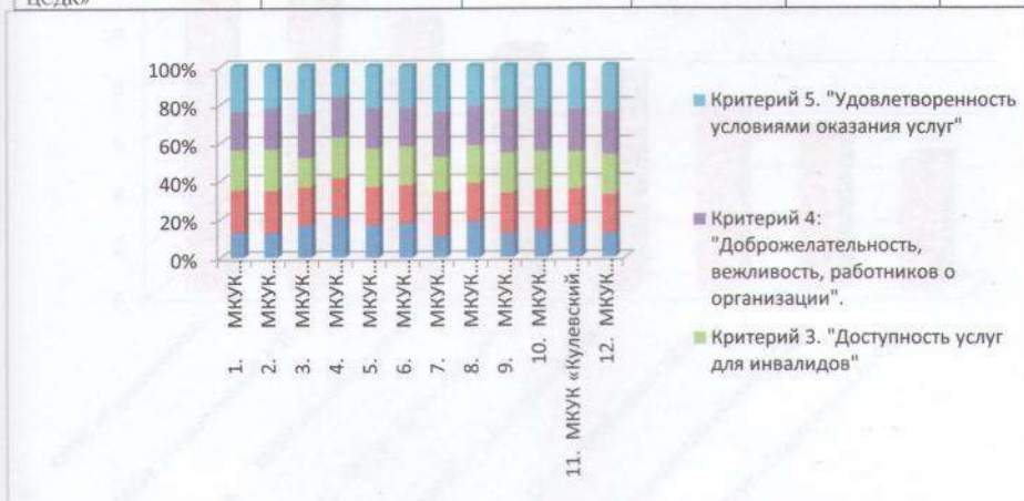
Рис. 6 Обобщенные сведения по всем критериям