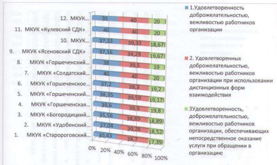
Рис.4 Сведения по критерию 4 «Доброжелательность, вежливость работников организации»