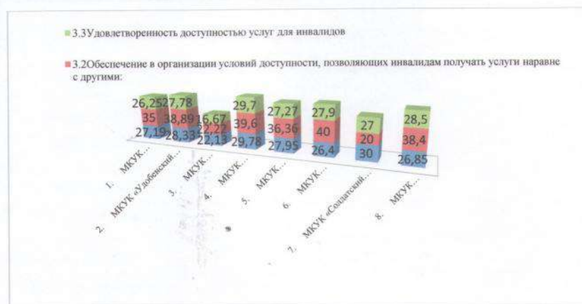
Рис.3 Сведения по критерию 3 «Доступность услуг инвалидов»