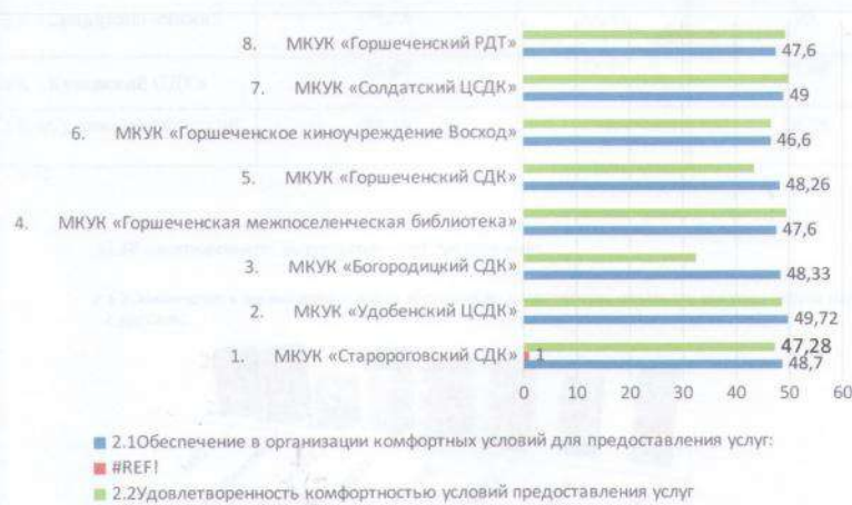
Рис.2 Сведения по критерию 2 «Комфортность условий предоставления услуг»

По третьему критерию «Доступность услуг для инвалидов» сведения представлены в таблице 4, рисунок 3.